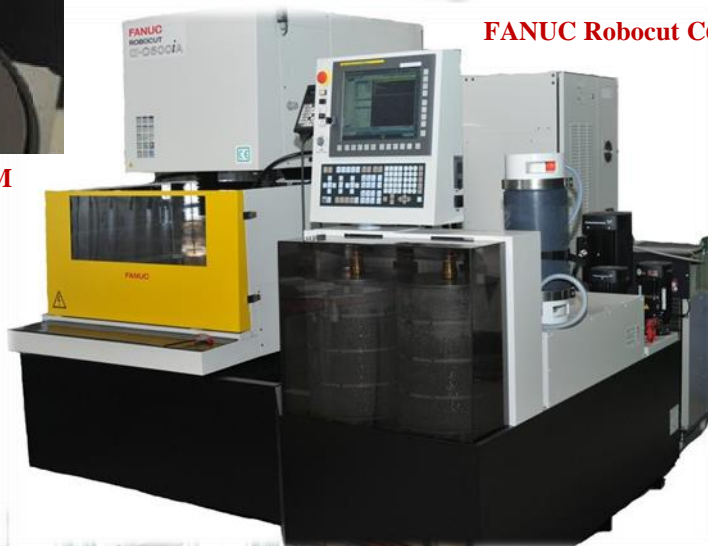
FANUC Robocut C600iA