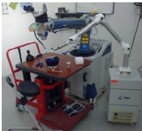
ALPHA LASER - ALM 200