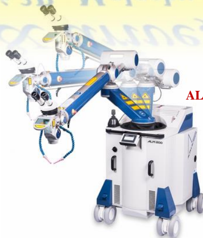
ALPHA LASER - ALM 200