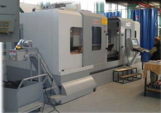
EUMACH VMC 2150